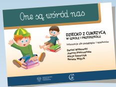
DZIECKO Z CUKRZYCĄ W SZKOLE I PRZEDSZKOLU

Dotychczas w serii „One są wśród nas” ukazały się: