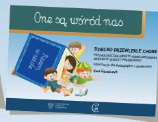
DZIECKO PRZEWLEKLE CHORE PSYCHOLOGICZNE ASPEKTY FUNKCJONOWANIA DZIECKA W SZKOLE I PRZEDSZKOLU