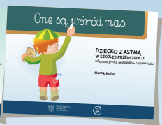
DZIECKO Z ASTMĄ W SZKOLE I PRZEDSZKOLU