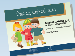
DZIECKO Z HEMOFILIĄ W SZKOLE I PRZEDSZKOLU