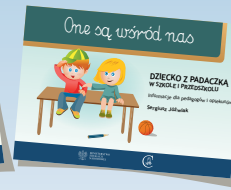
DZIECKO Z PADACZKĄ W SZKOLE I PRZEDSZKOLU